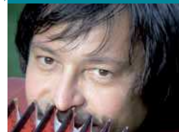
JEAN-MICHEL CORGERON spécialiste de l'accordéon diatonique