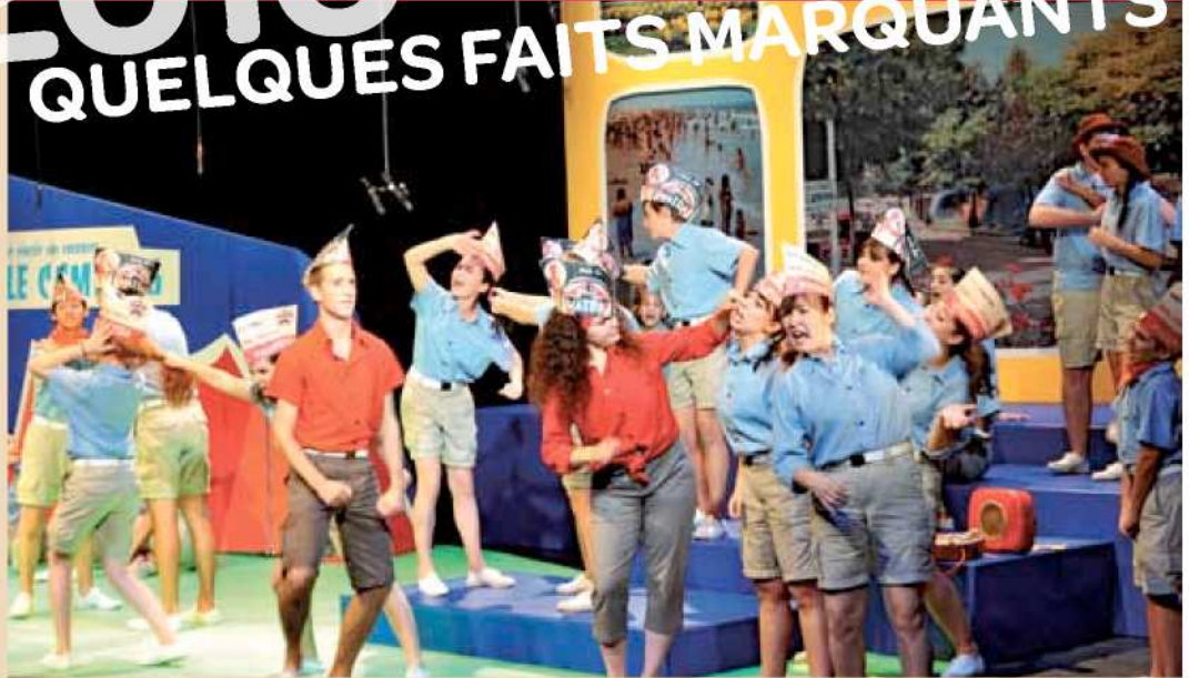
L'aventure continue en 2011 pour le CRÉA, invité aux Victoires de la musique classique en février.