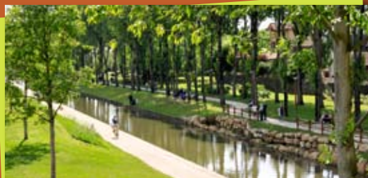
Canal de l'Ourcq